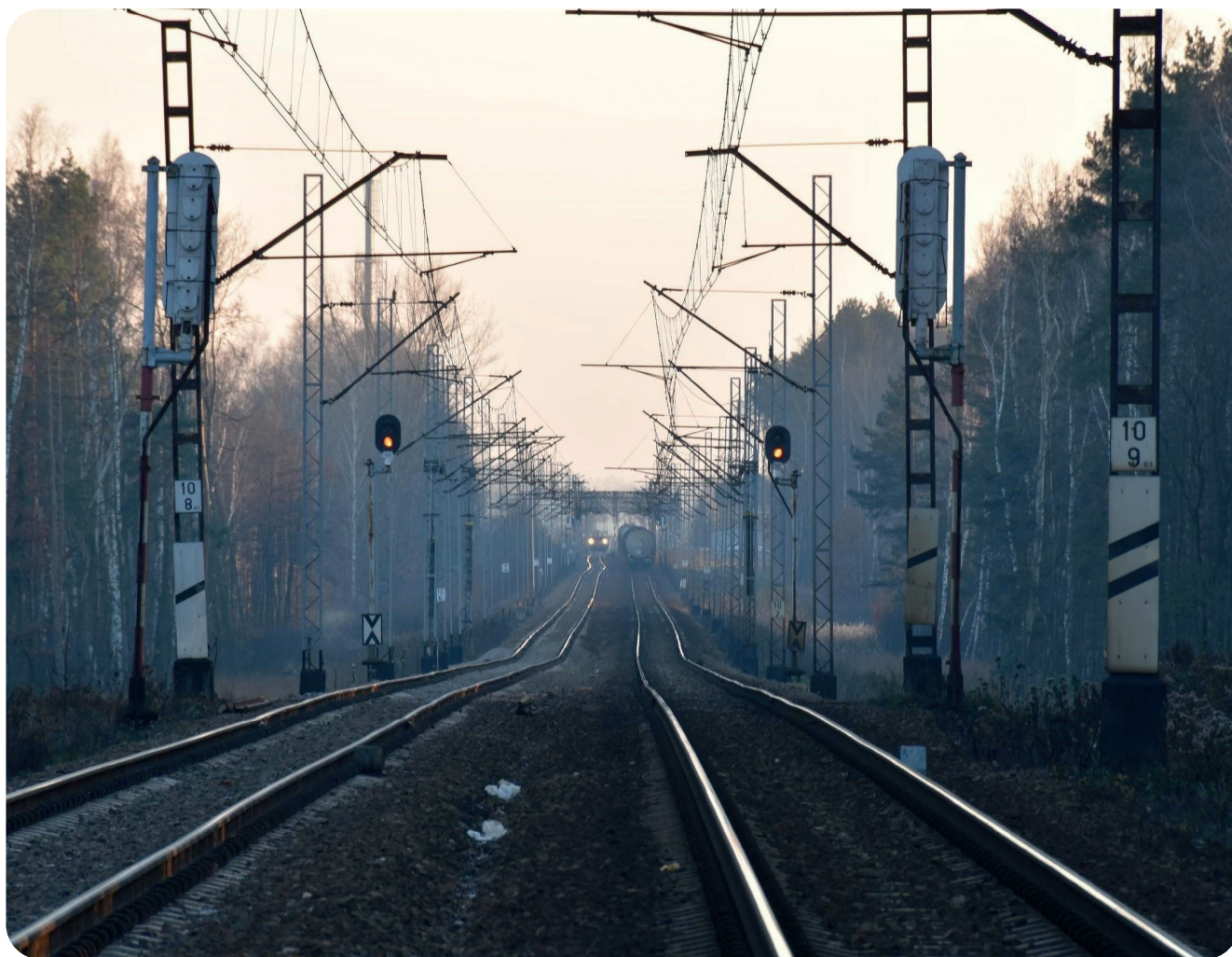
Tory kolejowe na trasie Imielin-Chetm Śląski – zdewastowane na skutek szkód górniczych, fot. Przemysław Zdziechiewicz (XI 2018)